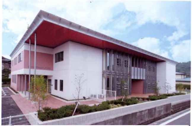
介護付き有料老人ホーム シルバードリーム 寿里

をしますかの問いにYESが中国87.7%、韓国57.2%、日本37.9%で断とつのビリであった。