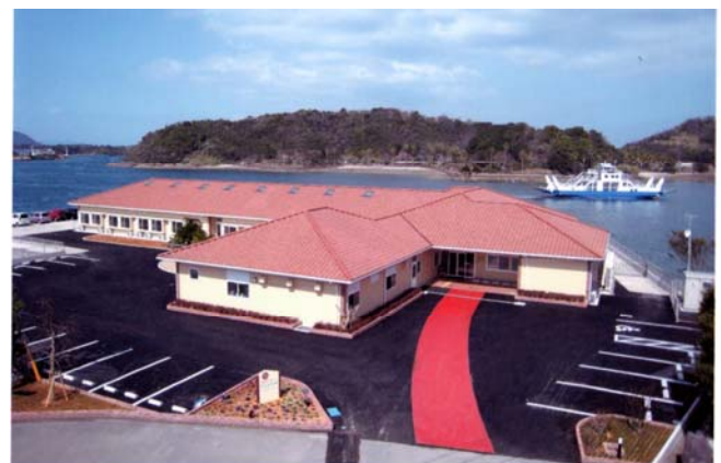
有料老人ホーム ウェルカメ

今、大事な何かを見失いつつある日本人に親の介護が期待できるのか、その覚悟が問われる。現在、介護離職者は年間10万人にも達し、その8割が女性で介護離職による貧困も大きな社会問題となりつつある。安倍総理は介護離職者ゼロを宣言した。女性の社会進出と在宅での終末という大きな矛盾を抱えている。