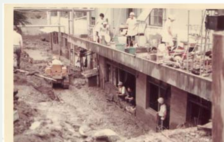
昭和47年 旧病院被災状

で被害を体験した職員は、僅かになっています。昼食会では、当時の写真を見たり、話を聞いたりして、実