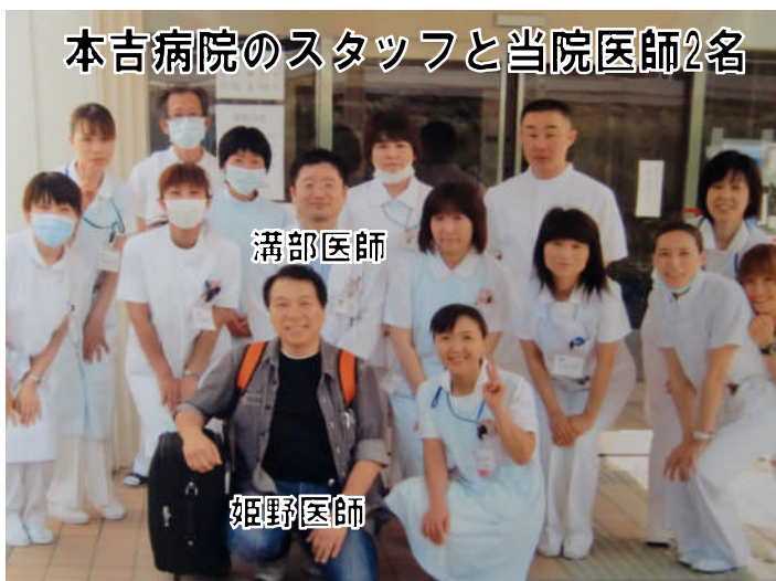
本吉病院のスタッフと当院医師2名

この1週間の大切なものを見せてもらったという体験が、そういう暖かい気持ちと、「被災地域の全ての人々が、心に秘めた辛い気持ちを押し殺して振る舞い、自分と仲間を信じて現実に立ち向かっている」という複雑な思いから、継続的な熱い支援の重要性をもっともっと多くの人に伝えたいという、込み上げてくる気持ちを感じながら気仙沼を後にしました。