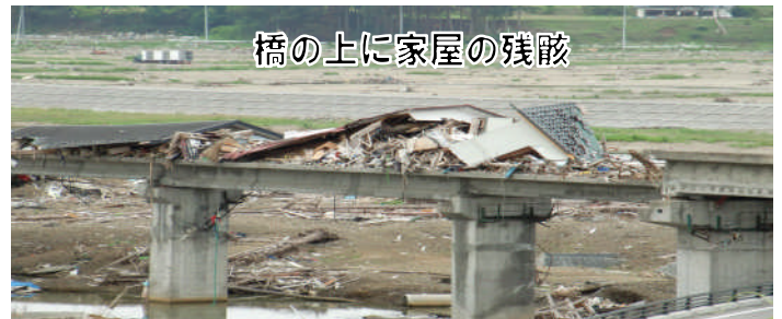
橋の上に家屋の残骸

国診協から『飲料水は持参、銀行のATMは多分使えない、現金を多めに準備』等の連絡が発2日前に届き、東北への乗り継ぎの東京で物資を調達しました。新幹線で一関に着いてみると、町並みは静かで普段通りの生活！コンビニにも物品はほぼ十分にあり、飲料水持参の話をするので笑われました。天草から所要12時間強で到着し、翌日朝より実働開始。市民や多くのボランティアの方々の懸命の労働で、泥水にすべてが浸