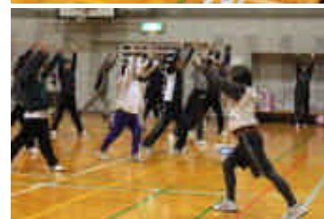
互助会ミニバレー大会でエアロビクスを取り入れた準備体操風景